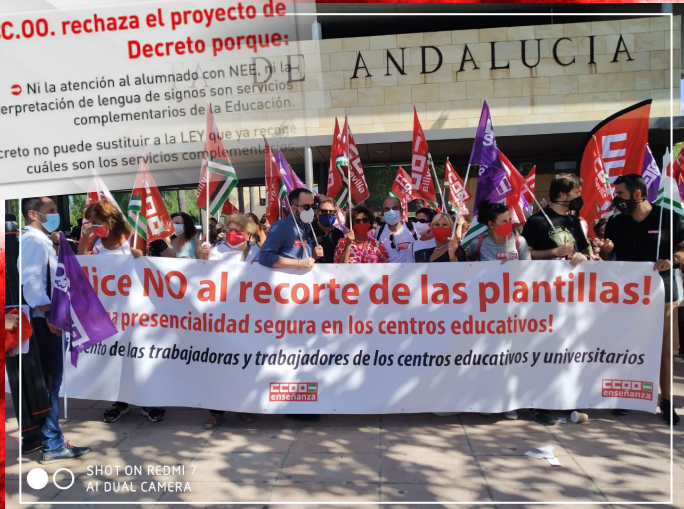
SHOT ON REDMI 7 AT DUAL CAMERA